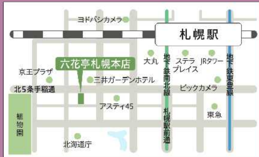
六花亭 札幌本店「ふきのとうホール」アクセス Map