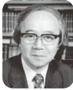
海老澤 敏 (10月30日、11月1日) Bin Ebisawa

東京生まれ。東京大学文学部美学美術史学科卒業、同大学院人文科学研究科美学専攻修士課程修了。1962年~64年、フランス政府給費留学生として滞仏。 尚美学園大学大学院名誉教授、日本モーツァルト研究所所長、ザルツブルク国際モーツァルト財団名誉財団員、同財団モーツァルト研究所所員、ポローニャ国立音楽アカデミー名誉会員、国立音楽大学元学長・理事長・学園長、新国立劇場前副理事長・同劇場オペラ研修所元所長。紫綬褒章他受章(賞)多数。文化功労者。